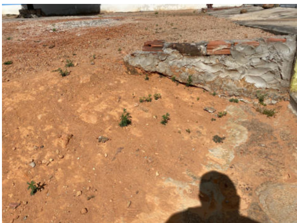
LOCAL DE DEMOLIÇÃO

Obra: CONSTRUÇÃO DE PRAÇA DE CONVIVÊNCIA NO SÍTIO BOM SUCESSO