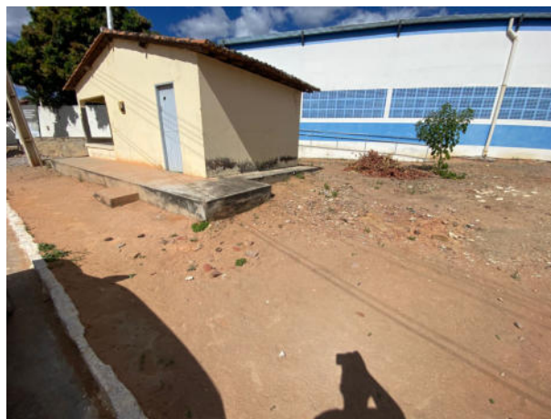
LOCAL DO CANTEIRO