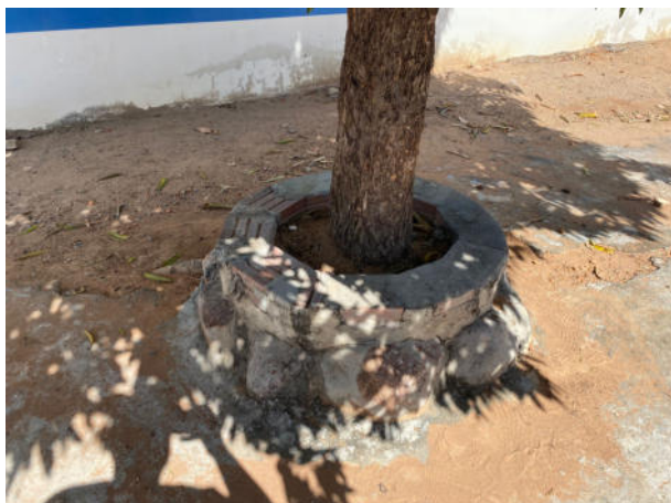
CANTEIRO DAS ARVORES