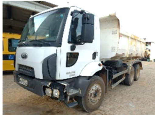
CAMINHÃO BASCULANTE FORD – MODELO: 2629 6X4 2013 – PLACA: OVZ-2746