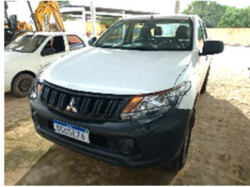
CARRO MITSUBISHI – MODELO: L200 TRITON 2.4 4X4 2018/2019 – PLACA: QGO-5E76