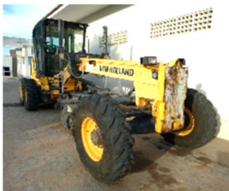
MOTONIVELADORA NEW HOLLAND – MODELO: RG 140B