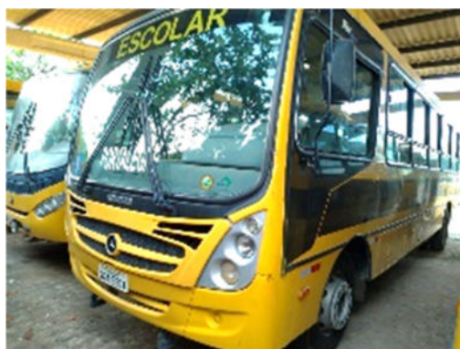
ÔNIBUS MERCEDES-BENZ – MODELO: OF-1519 R ORE 2014/2015 – PLACA: QGA-5501