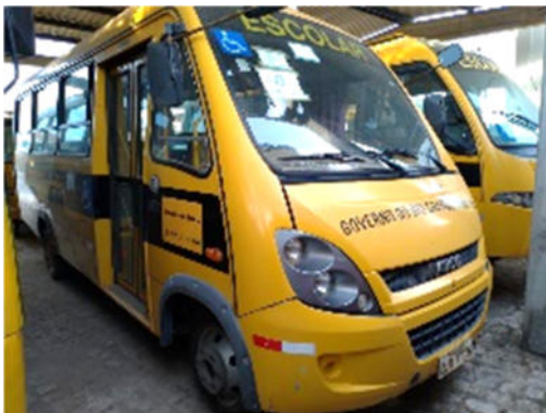
ÔNIBUS IVECO – MODELO: CITY CLASS 70C17 4X2 2012/2013 – PLACA: OJT-7775