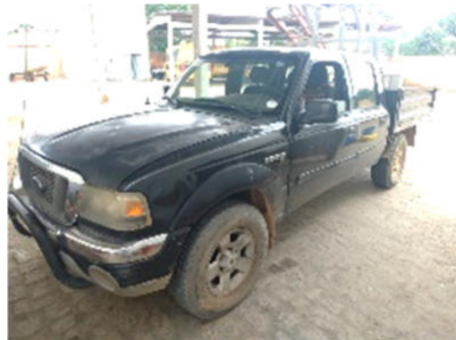
CARRO FORD – MODELO: RANGER XLT 3P 5P 163CV 2008 – PLACA: MZH-4523