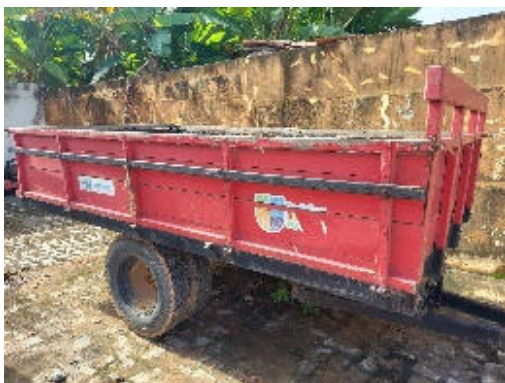
CARRETA TRATOR AGRÍCOLA