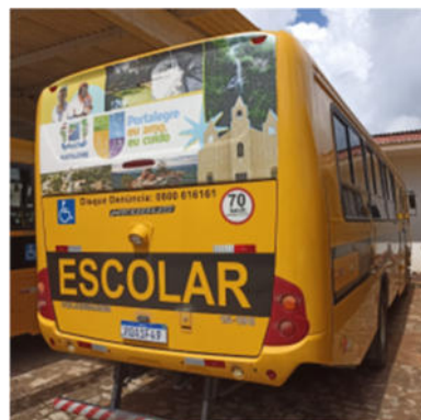
NEOBUS 15190 ESCOLAR VOLKSWAGEN - PLACA RQA 1F49