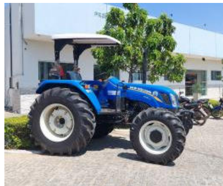
TRATOR NEW HOLLAND – MODELO: TT4.75