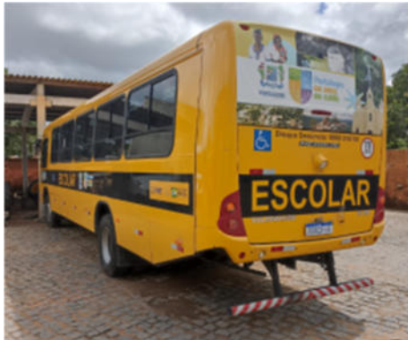
NEOBUS 15190 ESCOLAR VOLKSWAGEN - PLACA RQA 1F68