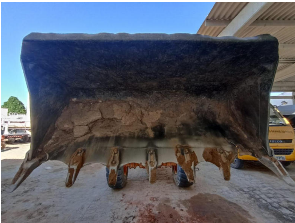
FOTO REAL DA CONCHA DA PÁ CARREGADEIRA - HYUNDAI – MODELO: HL740-9S