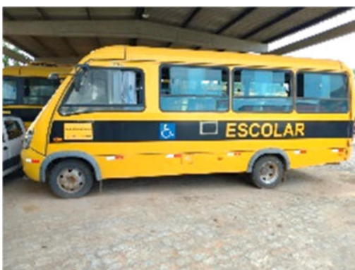
ÔNIBUS IVECO – MODELO: CITY CLASS 70C17 2012/2013 – PLACA: OJZ-2140