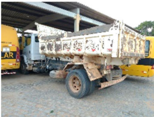
CAMINHÃO BASCULANTE MERCEDES-BENZ – MODELO: ATRON 1319 2013 – PLACA: OWD-4698