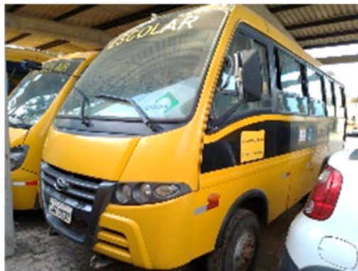
ÔNIBUS MARCOPOLO – MODELO: VOLARE V8L 4X4 2012/2013 – PLACA: OJZ-0637