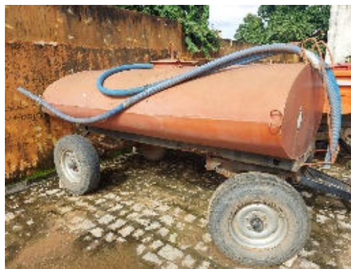
CARRETA TANQUE PIPA PARA TRATOR