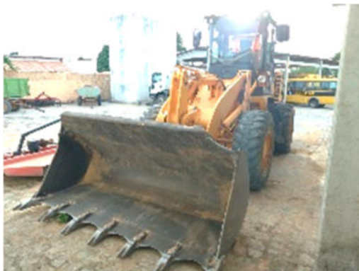
PÁ CARREGADEIRA HYUNDAI – MODELO: HL740-9S