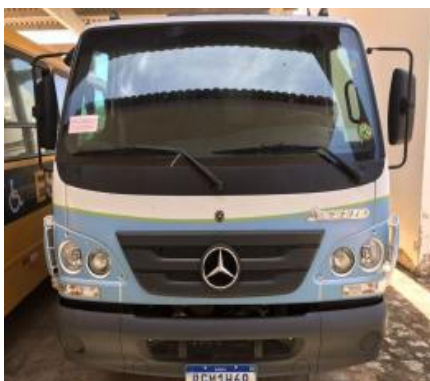
CAMINHÃO DE CARGA MERCEDES BENZ – MODELO: ACELLO 815 CE – PLACA RGM 1H69