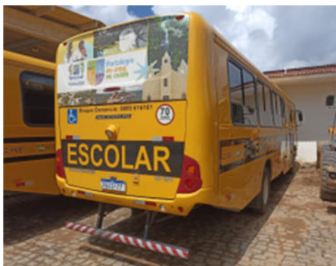
NEOBUS 15190 ESCOLAR VOLKSWAGEN - PLACA RQA 1F77