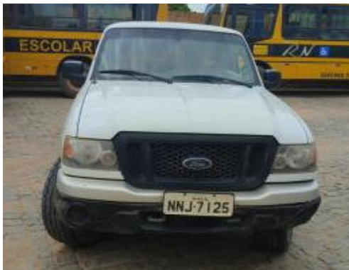
CARRO FORD – MODELO RANGER XL 3P - ANO: 2008 – PLACA NNJ 7125