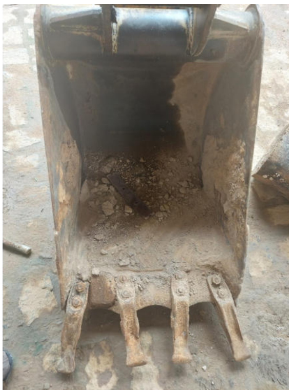
FOTO REAL DA CONCHA DA RETROESCAVADEIRA RANDON – MODELO: RD 406 2013/2014