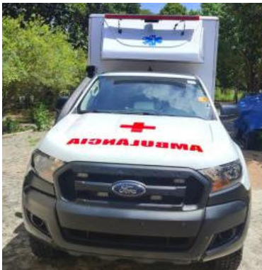
AMBULÂNCIA FORD RANGER XL CS4 – TIPO A 4X4 – PLACA: RPQ7D58