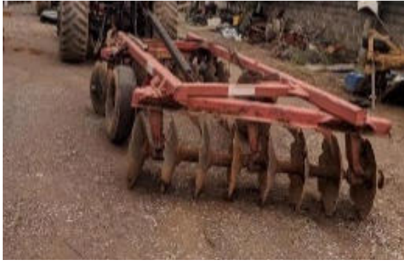
GRADE DE ARRASTO KLR PARA TRATOR AGRÍCOLA