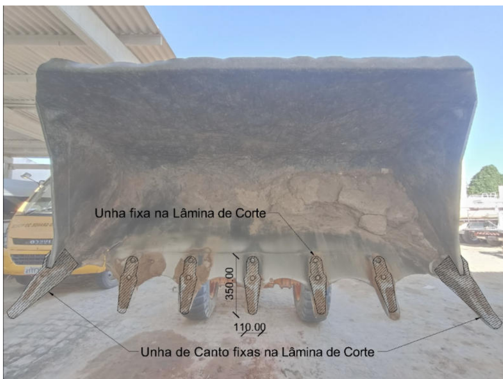
CROQUI DE RESTAURAÇÃO DAS UNHAS DA PÁ CARREGADEIRA- ITEM 1