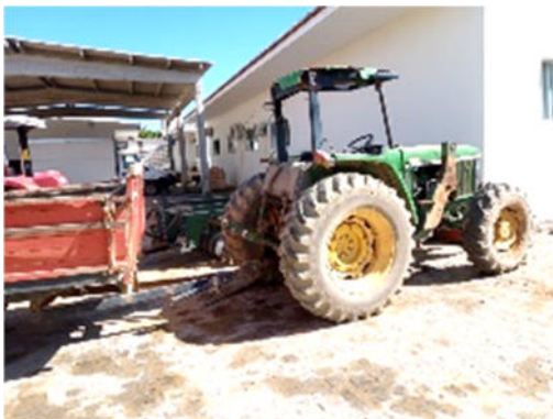
TRATOR JOHN DEERE – MODELO: 5700 2002