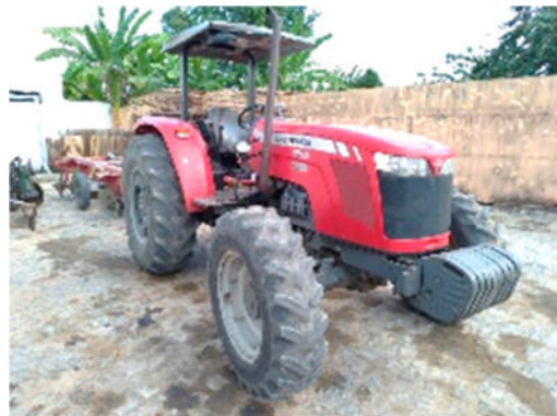
TRATOR AGRICOLA MASSEY FERGUSON – MODELO: 4283 4CH 2014/2015