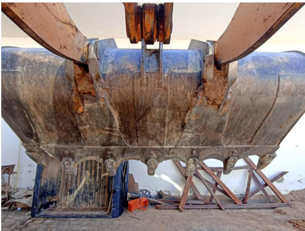
FOTO REAL DA PARTE POSTERIOR DA CONCHA DA PÁ CARREGADEIRA - HYUNDAI - MODELO: HL740-9S