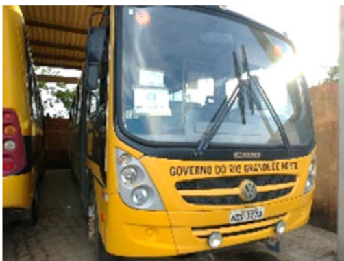
ÔNIBUS VOLKSWAGEN – MODELO: 15.190 EOD E.S ORE 2011/2012 – PLACA: NOG-3778