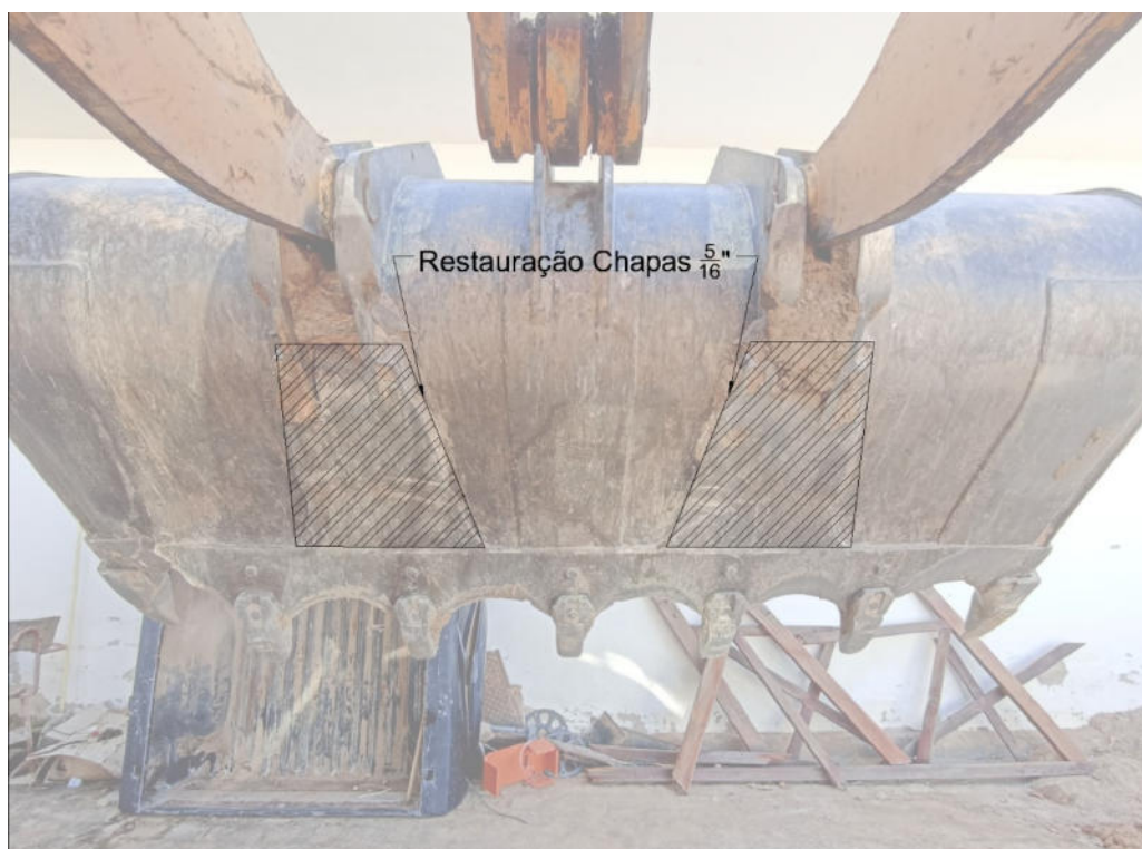
CROQUI CHAPA DE AÇO 5/16" NA PARTE POSTERIOR DA CONCHA DA PÁ CARREGADEIRA- ITEM 3