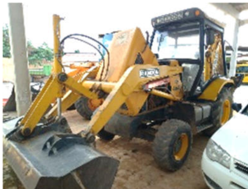
RETROESCAVADEIRA RANDON – MODELO: RD 406 2013/2014