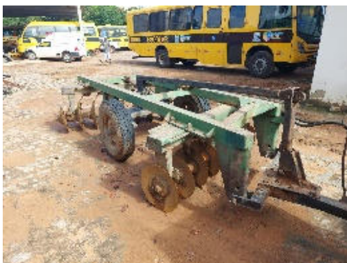
GRADE DE ARRASTO PICCIN PARA TRATOR AGRÍCOLA