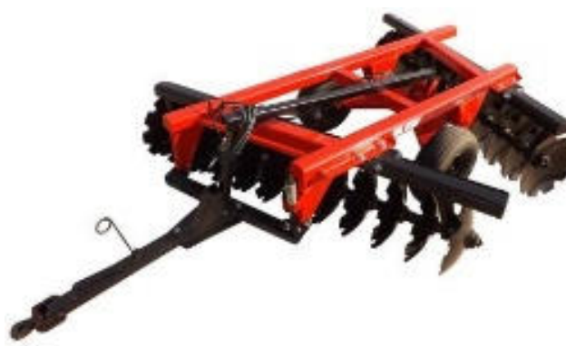
GRADE DE ARRASTO TATU PARA TRATOR AGRÍCOLA