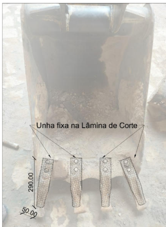
CROQUI RESTAURAÇÃO DAS UNHAS DA RETROESCAVADEIRA – ITEM 2