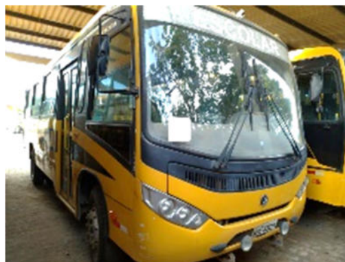
ÔNIBUS VOLKSWAGEN – MODELO: 15.190 EOD E.HD ORE 2010/2011 - PLACA: NOE-4360