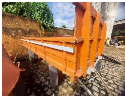
CARRETA TRATOR AGRÍCOLA