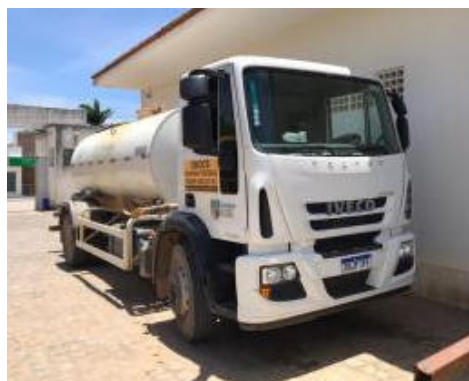
CAMINHÃO TANQUE IVECO – MODELO: TECTOR 170E21 – PLACA RGJ 7189