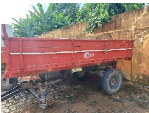
CARRETA TRATOR AGRÍCOLA