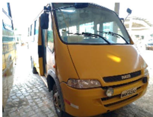
ÔNIBUS IVECO – MODELO: CITY CLASS 70C16 2010 – PLACA: NNW-6292