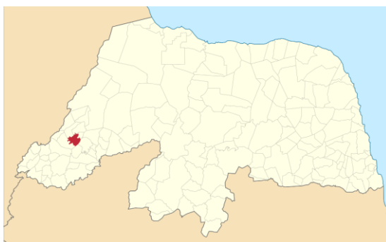
Figura 1: Localização de Portalegre no Mapa do RN.