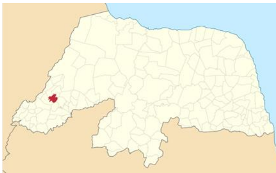
Figura 1: Localização de Portalegre no Mapa do RN.