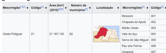
Figura 1: Mesorregião Oeste Potiguar

mercados) da Lei Complementar 123/2006, especificamente o § 3º do Art. 48, e alterações da Lei Complementar 147/2014, conforme imagem a seguir: