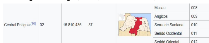
Figura 2: Mesorregião Central Potiguar