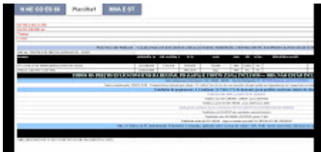
WhatsApp Image 2023-10-23 at 11.03.38.jpeg 161K