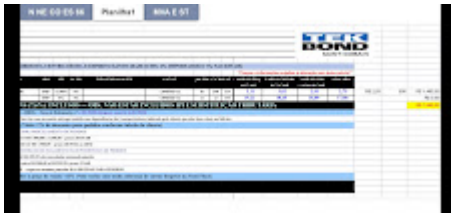
WhatsApp Image 2023-10-23 at 11.03.35.jpeg 145K